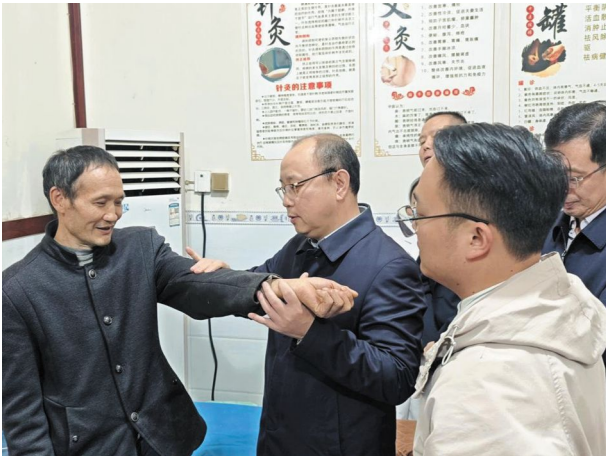
调研组在仙峰苗族乡卫生院走访氟骨症患者

人员和管理人员进行了讨论,针对存在的问题提出意见和建议。何光伦同志总结发言,强调了地方病防控工作的重要性,并指出下一步工作重点方向。