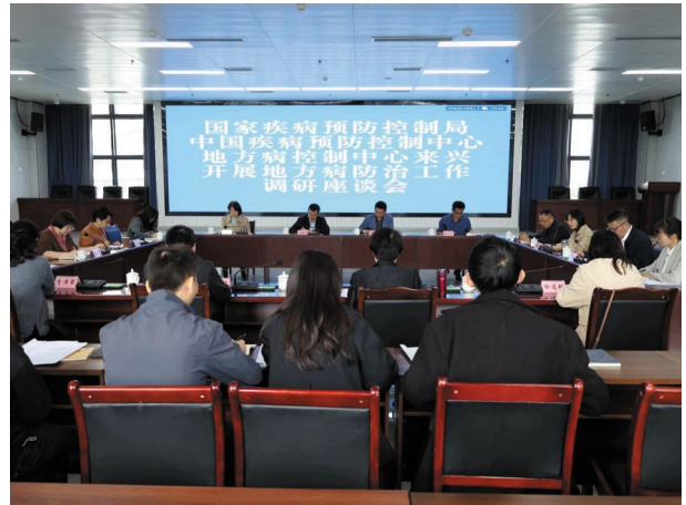
调研组在兴文县疾控中心召开座谈会

人员和管理人员进行了讨论,针对存在的问题提出意见和建议。何光伦同志总结发言,强调了地方病防控工作的重要性,并指出下一步工作重点方向。